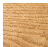
Rouvre naturel (RN)